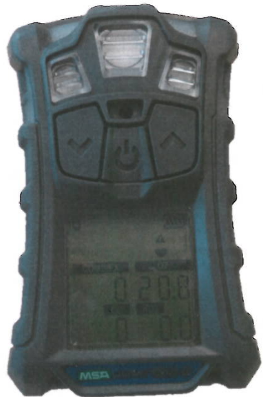
б) версия с обычным корпусом