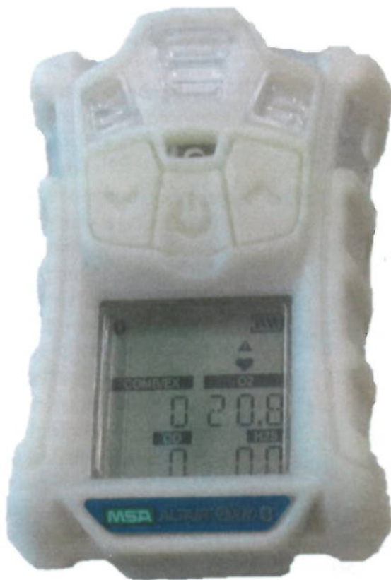
а) версия с фосфоресцирующим корпусом

Схема пломбировки корпуса газоанализаторов от несанкционированного доступа приведена на рисунке 2.